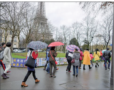
巴黎艾菲尔铁塔下的真相点帮助大陆游客三退