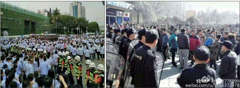
上图：黑龙江双鸭山矿业集团上万名矿工上街游行堵铁路；左下图：广东深圳雅骏眼镜制造有限公司工人罢工围堵龙岗区政府，与警察发生冲突；右下图：吉林通化钢铁集团股份有限公司上千名工人抗议公司拖欠工资。

可能是担心引发大规模的社会动荡，上世纪90年代末期，企业重组期间引发的动荡局面曾使东北老工业区瘫痪。