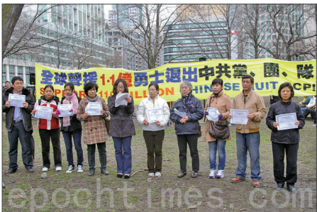
多伦多声援三退集会活动上有十位华人公开三退，领取三退证书。