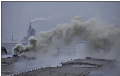
绍兴滨海工业区，染料厂的烟囱冒出滚滚浓烟。