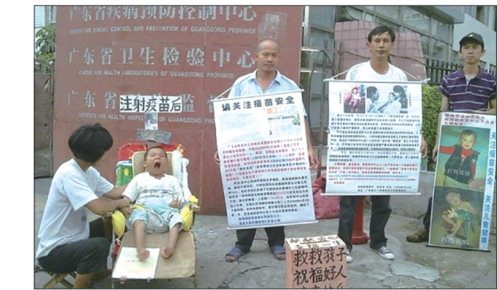
毒疫苗受害家长抗议讨公道

山东东营市利津县数十名孩子家长游行示威至县政府，要求政府就毒疫苗事件给民众一个说法，遭到警察镇压。