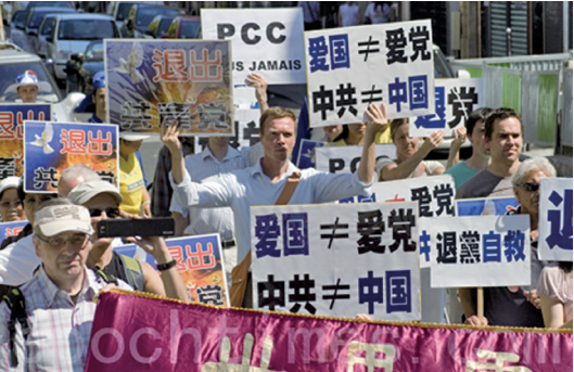
巴黎声援三退保大潮游行