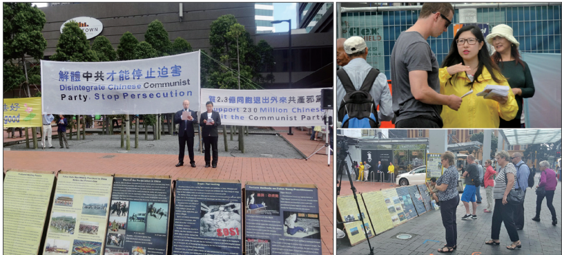
新西兰举办声援二亿三千万人三退集会，新西兰民众驻足观看真相展板。

著名人权律师凯瑞·戈尔先生也来到活动现场支持，他表示中共对人权的迫害一天不结束，退党大潮必将继续下去，而中共的执政合法性无论从道德上、从智慧上，还是从政治上都必将走到尽头。“中国人也必将重新找回其精神、文化和历史传承，一个崭新的中国即将诞生！”