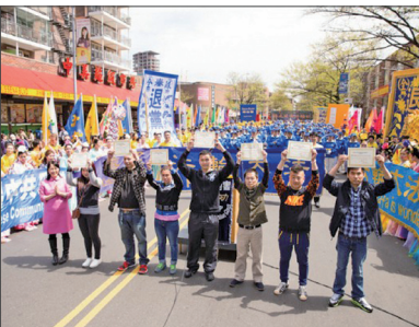
纽约纪念425集会上七位华人公开退出中共，并领取三退证书。