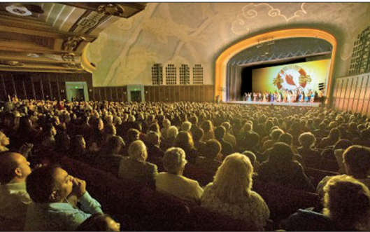
神韵艺术团在洛杉矶及周边城市创下下场场爆满的票房记录

详细演出讯息请见神韵官网： zh-tw.shenyunperformingarts.org/