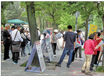
中国大陆游客在台北国父纪念馆前观看真相展板

重庆有位年逾花甲的法轮功学员实名邮寄控告江泽民的刑事控告信。两名警察上门盘问，这位法轮功学员告诉警察：法轮功学员控告江泽民是还人间正道，还法轮功清白。他说：“我若配合