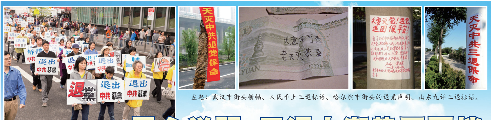
左起：武汉市街头横幅、人民币上三退标语、哈尔滨市街头的退党声明、山东九评三退标语。