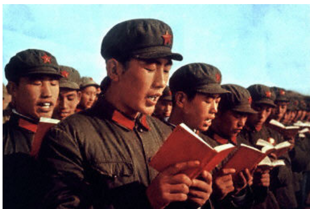
Културната революция бе времето, в което "Слънцето е най-червеното", докато "Светът е най-тъмния". Всеки трябваше да изучава трудовете на Мао"

Крахът на социалистическия блок след края на Съветския съюз в началото на 90-те години беляза провала на комунизма, след почти столетие на съществуването му. Обаче Китайската комунистическа партия (ККП) неочаквано оцеля и все още управлява Китай, нация, която представлява една-пета от населението на света. Появява се следният въпрос: останала ли е ККП днес действително комунистическа?