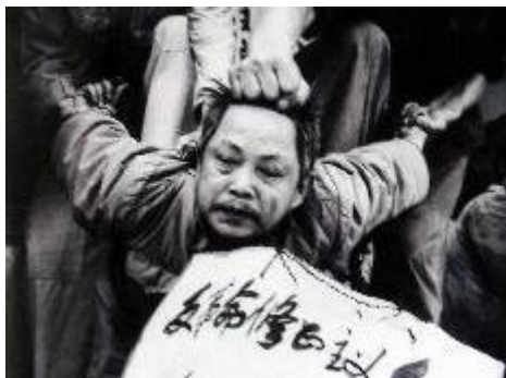
Фото досие, показващо атаката и денонсирането на "контрареволуционер" от активисти на ККП

Петдесет и пет годишната история на Китайската комунистическа партия (ККП) е написана с кръв и лъжи. Човешките преживявания зад тази кървава история са извънредно трагични и рядко срещани. Под управлението на ККП, 60 до 80 милиона невинни китайци са убити, изоставяйки разбити семейства. Много хора се чудят защо ККП избива хора. Докато партията продължава бруталното преследване на практикуващите Фалун Гонг и съвсем наскоро потуши тълпата от протестиращи в Ханюан с изстрели, хората се чудят дали някога ще доживеят деня, когато ККП ще се научи да говори с думи вместо с огнестрелни оръжия.