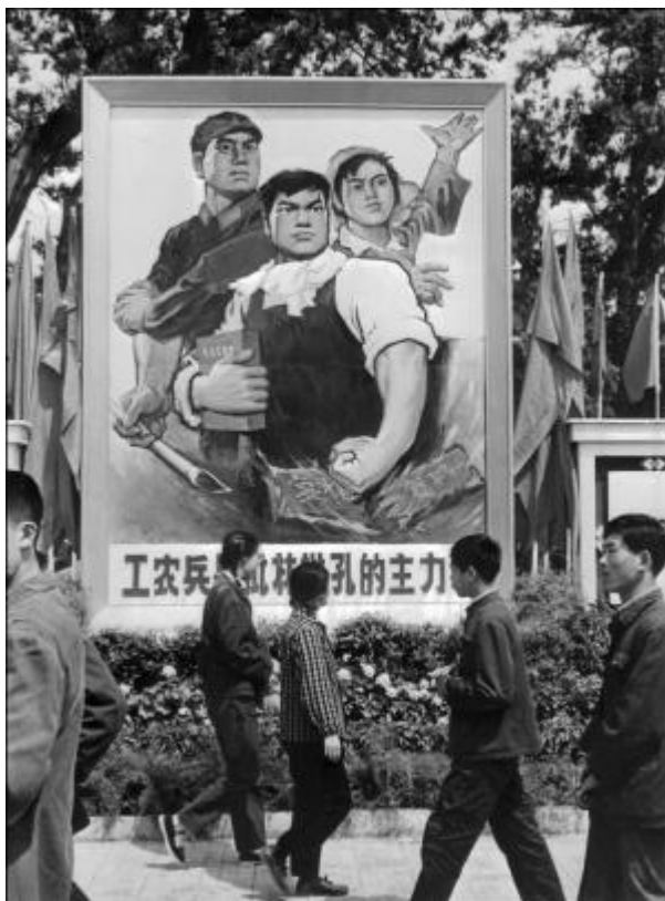
Плакат от кампанията „Критика към Лин Биао и Конфуций“

Културата е душата на една нация. Този духовен фактор е толкова важен за човечеството, колкото са важни физическите фактори като раса и земя.