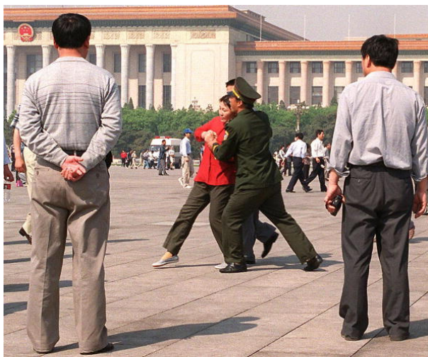
Полицията арестува Фалун Гонг практикуващи, които апелират мирно на площад Тянанмън на 11 май 2000 година.

Комунистическото движение, което надуваше фанфарите повече от век, донесе на човечеството само войни, бедност, бруталност и диктатура. С падането на Съветския съюз и комунистическите партии в Източна Европа в края на миналия век тази пагубна, жестока драма най-после навлезе в последната си фаза. Сега от обикновените граждани до генералния секретар на комунистическата партия, вече никой не вярва в мита за комунистическата партия.